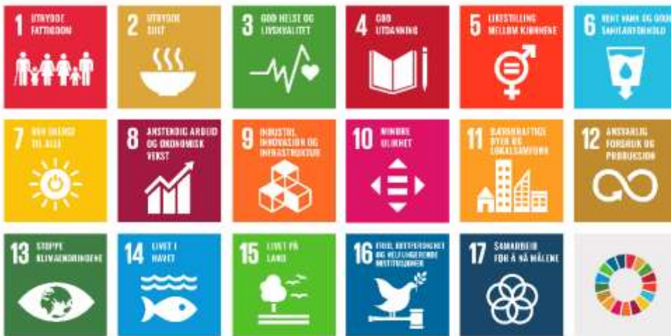
Figur 1: Oversikt over FNs bærekraftsmål

FN velger ofte å illustrere de 17 bærekraftsmålene ved bruk av ett venndiagram som vist i figur 1. Ved å illustrere målene i et venndiagram gis det også et signal om at det er balanse mellom målene og de tre dimensjonene i bærekraftig utvikling; økologisk, sosial og økonomisk bærekraft.