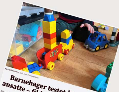
Barnehager testet å ha flere ansatte - fikk ned sykefraværet Elleve barnehager i Trondheim testet å ha en ekstra ansatt, noe som fikk ned sykefraværet hos hele staben.