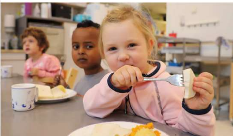
NÆRVÆR: I Sandvikveien barnehage har dei snudd fokus, og måler nærvær i staden for fravær.

STAVANGER (NRK): Ved å redusere talet på barn per tilsett, gjekk sjukefraværet kraftig ned. Ikkje ein einaste vikar vart brukt.