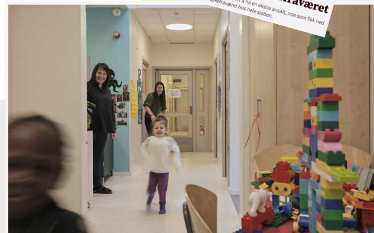
Utdanningsnytt besøkte Bekkaret barnehage i Ørland i vinter. De er en av barnehagene i prosjektet med økt bemanning i kommunen. Vis mer