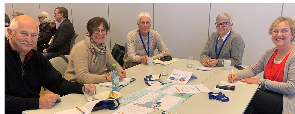
Eldrerådet i Sola, perioden 2023 - 2027:

Gjennom rådet kan medlemmene påvirke og delta, og dermed ivareta eldres interesser i beslutningsprosessene.