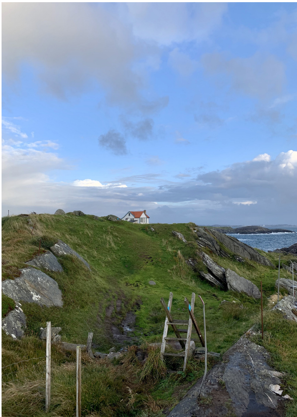
Kyststien – Vigdelsneset.