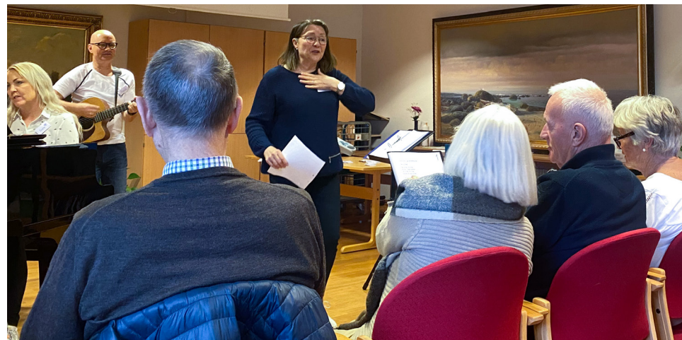
Gladsangkoret i Sola.