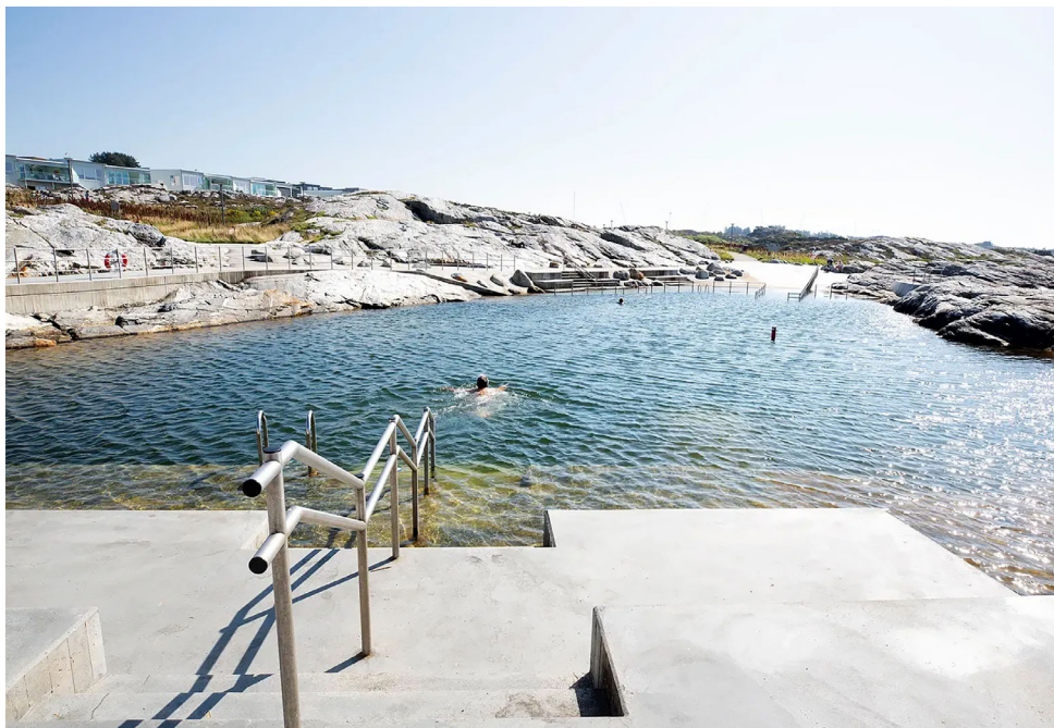
Sjøbadet på Myklebust