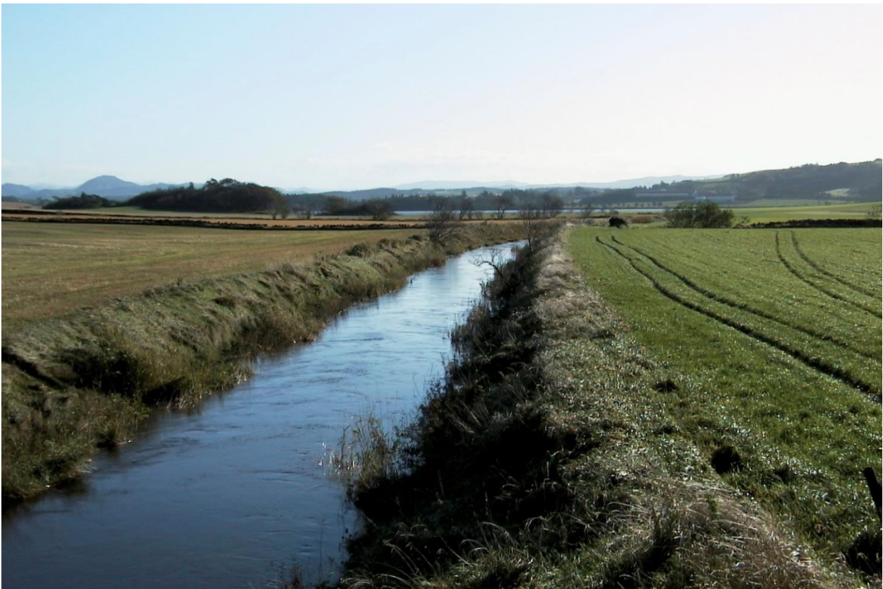
Foto 6 Skas-Heigre kanalen

Åpning av bekker vil ha en positiv effekt både med hensyn til biologisk mangfold, men også gjennom økt mulighet for rensing av næringsstoff og avrenning fra landbruket. I søknader om støtte til å åpne lukka vannløp, skal områder som drenerer til prioriterte vassdrag også prioriterest.