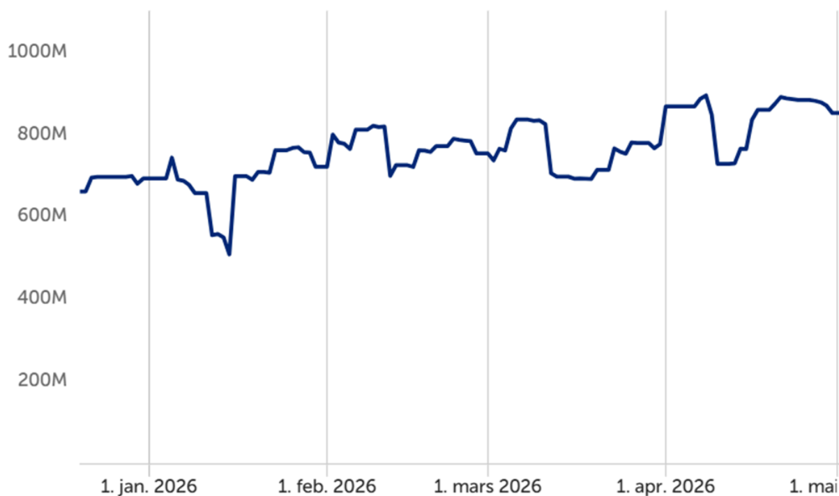
Utvikling i likviditet

Grafen under viser likviditetsutvikling fom jan til april 2026: